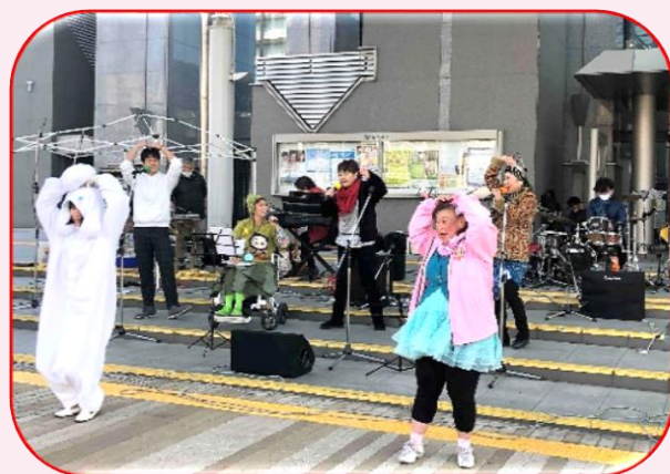
ハロウィンも、クリスマスも、お正月もイベントは全て中止。3/14にやっと開催された堺市役所前でのにぎわい市ステージです。

仲間と一緒に踊りたい。緊急事態宣言解除後の練習日、小学生から70代まで17名集まりました。音曲も振付も忘れず、みんなでノリノリで踊れて楽しかったです。