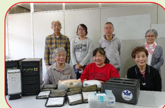
今年度の活動紹介用に撮影しました