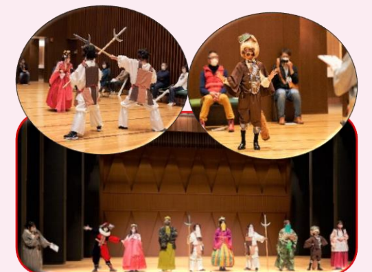
どこでも劇場 IN サカイシティワンダーランド