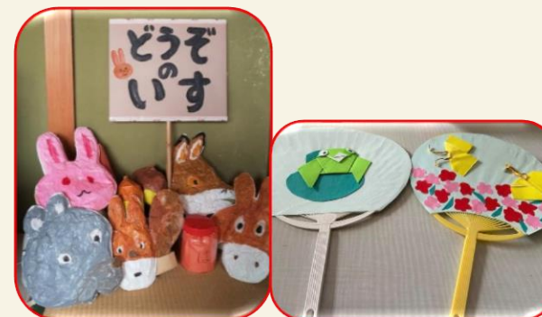
小道具作りに励みました

コロナ禍で新しい演劇のカタチを模索し、いつでもどこでも開催できるコンパクト演劇「どこでも劇場」を作りました！